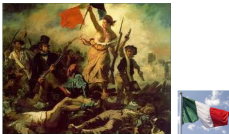
Movimento Politico Italiano

LA RICCHEZZA DELLE POVERTA' - SAGGIO ECONOMICO SOCIALE